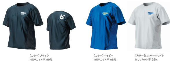
【カラー】ブラック ※UVカット率 99%