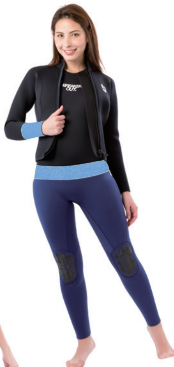
ロングジョン [ベース] ブラックジャージ [ライン] (ウエスト) ブルーヘザー [ポイント] ネイビー [マーク] ホワイト